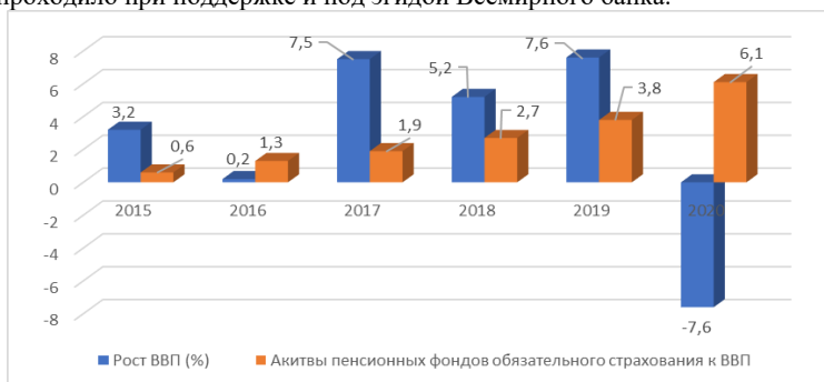
Рисунок 1. Темпы роста ВВП и соотношения активов пенсионных фондов обязательного страхования к ВВП (%).

Пенсионная реформа в РА – одна из масштабных проводимых социальных реформ, начала реализовываться в 2010 г. на основе принятого Закона РА «О накопительных пенсиях». Введение многокомпонентной накопительной модели в РА проходило при поддержке и под эгидой Всемирного банка.